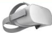
ОЧКИ ВИРТУАЛЬНОЙ РЕАЛЬНОСТИ